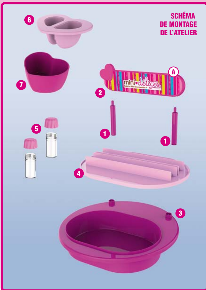
SCHEMA DE MONTAGE DE L'ATELIER

- Demande à un adulte de te donner le matériel nécessaire à la réalisation des messages en chocolat et quelques feuilles de papier essuie-tout.